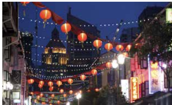
Un Chinatown au cœur de Liège, du 9 au 12 juin.

Plus d'infos très prochainement sur le site web et les réseaux sociaux (Facebook, Twitter) de la Province de Liège : www.provincedeliege.be