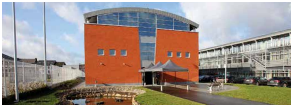
Le bâtiment «Guy Martin» est la phase 2 de la Maison de la Formation à Seraing.

des micros individuels. Un local de régie permet de commander les mannequins et les simulations ainsi que leur retransmission audiovisuelle vers d'autres locaux.