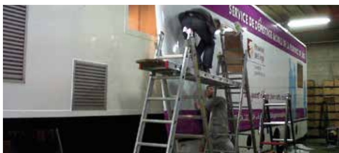
Geer, Saint-Nicolas, Spa et Visé : 4 communes pilotes pour une campagne en 3 temps.