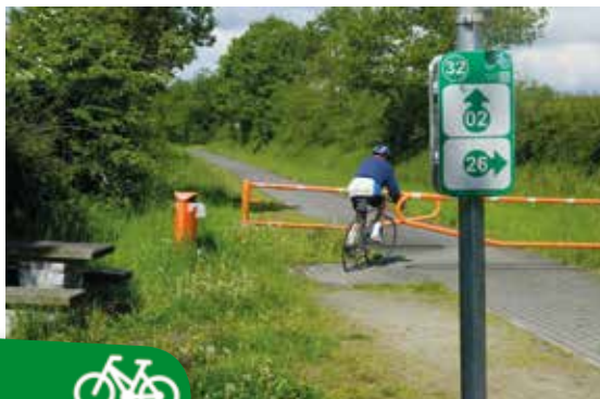
Circuler sans carte grâce aux points-nœuds.

Cela fait plus d'un an que la Fédération du Tourisme de la Province, en synergie avec Liège Europe Métropole, établit un plan de balisage et de marquage des itinéraires cyclables des communes concernées. L'objectif étant de répondre à la demande croissante des familles, enfants, jeunes actifs, adultes, seniors... plus communément appelés des « vélo-touristes ». Ce projet va leur permettre de circuler sans carte sur des milliers de kilomètres. Ce principe est bien connu de ces pédaleurs : les points-nœuds se situent à chaque croisement du réseau, ils sont numérotés, ce qui indique la direction