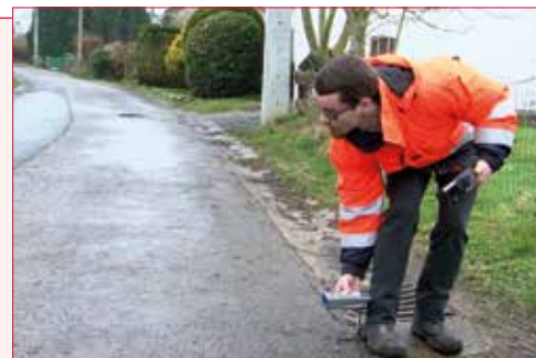
Les voiries communales représentent 90% du réseau routier wallon.

Les communes peuvent bénéficier d'un accès au portail cartographique en adhérant, par l'intermédiaire de la Province de Liège, au Groupement d'Informations Géographiques. Qui plus est, cet outil et l'accompagnement technique par la Province lors de la mise en œuvre du projet leur sont fournis gratuitement ! Le seul élément à investir est le temps nécessaire à la récolte des données ainsi