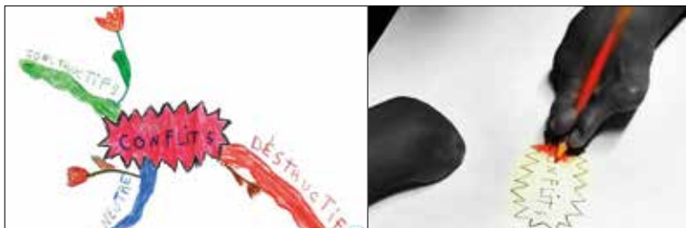
Élève réalisant une carte mentale sur le conflit, IPESS de Micheroux.