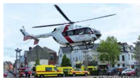
Juin 2016, accident de la circulation DALHEM (Visé).