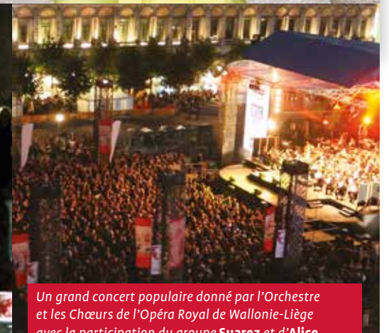
Un grand concert populaire donné par l'Orchestre et les Chœurs de l'Opéra Royal de Wallonie-Liège avec la participation du groupe Suarez et d'Alice On the Roof pour une chanson unique.