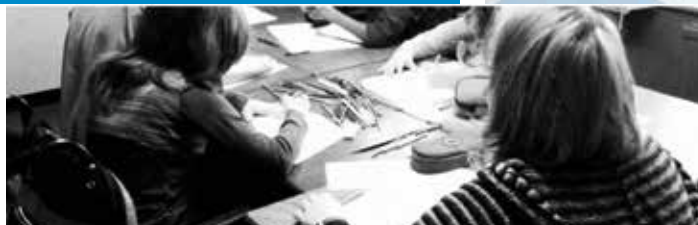
Atelier « Mind Mapping », cours de Religion catholique, IPESS de Micheroux.

Depuis 3 ans, l'Institut provincial d'Enseignement secondaire spécialisé de Micheroux (IPESS Micheroux) propose une nouvelle méthode d'intégration pédagogique pour ses élèves, le Mind mapping.