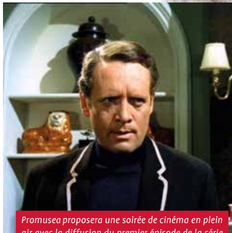
Promusea proposera une soirée de cinéma en plein air avec la diffusion du premier épisode de la série « Le Prisonnier ».

> Nombre de places limité - réservation indispensable : brel@provincedeliege.be