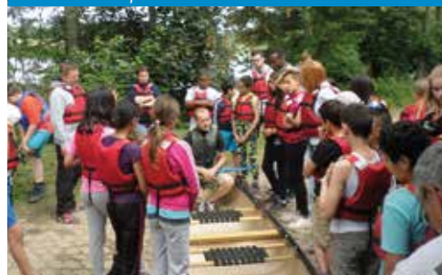
Visite acrobatique du Centre de Worriken.

Des nouveautés et de l'aventure pour les élèves, le concours de la BRF et de la Province ne manquera pas de susciter de l'engouement pour une deuxième édition voire, qui sait, une vocation journalistique chez certains. ■