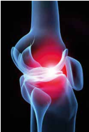
L'arthrose du genou est l'une des formes les plus invalidantes d'arthrose

Cette maladie, caractérisée par une dégradation du cartilage des articulations sur diverses parties du corps comme la hanche, le genou ou l'épaule, touche 20% de la population. L'arthrose se caractérise par une douleur au mouvement ainsi que des articulations raides et déformées qui peuvent entraîner une sédentarité accompagnée d'un risque de diabète, d'obésité et de maladies cardio-vasculaires. Elle concerne essentiellement les personnes de plus de 65 ans mais pas seulement: des patients plus jeunes peuvent être touchés suite à un facteur génétique