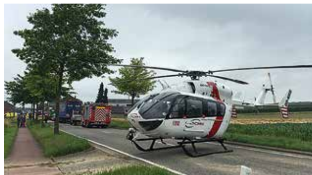
Avril 2016, atterrissage Centre de Welkenraedt.

S'affilier au CMH, c'est adhérer à un projet de santé publique, disponible pour tout patient: vous-même, un proche de votre famille, un voisin, un ami ou toute autre personne dont la vie est en jeu. S'affilier, c'est contribuer à réduire les coûts d'intervention pour tous les patients. Être affilié au CMH, c'est participer