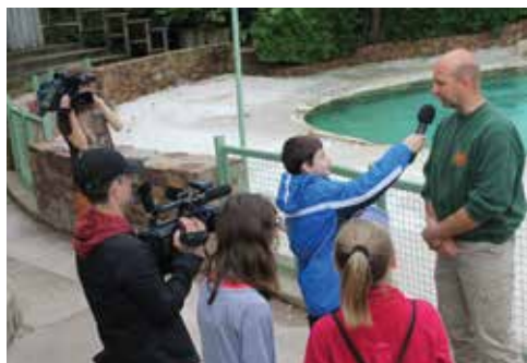
Reportage au Monde Sauvage d'Aywaille.

Les participants devaient réaliser des slogans publicitaires originaux sur des sites touristiques d'opérateurs partenaires du territoire provincial. A la clé, des journées découvertes à gagner au cours desquelles les élèves les plus créatifs ont eu l'occasion de s'essayer au métier de journaliste tout en visitant les sites de leur choix. Micro à la main, accompagnés de leurs enseignants et d'une équipe de