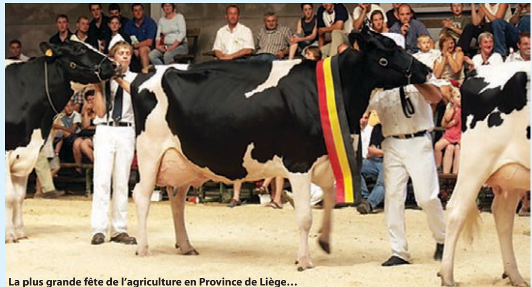
La plus grande fête de l'agriculture en Province de Liège...

L'espace « Eau et agriculture » abordera les actions entreprises pour limiter, voire supprimer, les pollutions des eaux par des engrais ou fertilisants d'origine agricole. Ainsi, chez nous, la Station provinciale d'Analyses agricoles effectue des prélèvements pour garantir une utilisation des sols respectueuse de l'environnement. « Énergie et agriculture » fera largement écho au développement des biocarburants qui ont un bel avenir dans notre province (Biowanze). Et il y sera également question d'éco-construction et des solutions écologiques intéressantes que présente notamment la culture du chanvre industriel encouragée depuis plus d'un an par les Services agricoles provinciaux et la SPI+. Un espace sera presque entièrement consacré au projet costarmoricain RAFANEL visant à favoriser la commercialisation de produits locaux de qualité issus d'une agriculture respectueuse de l'environnement. Enfin,