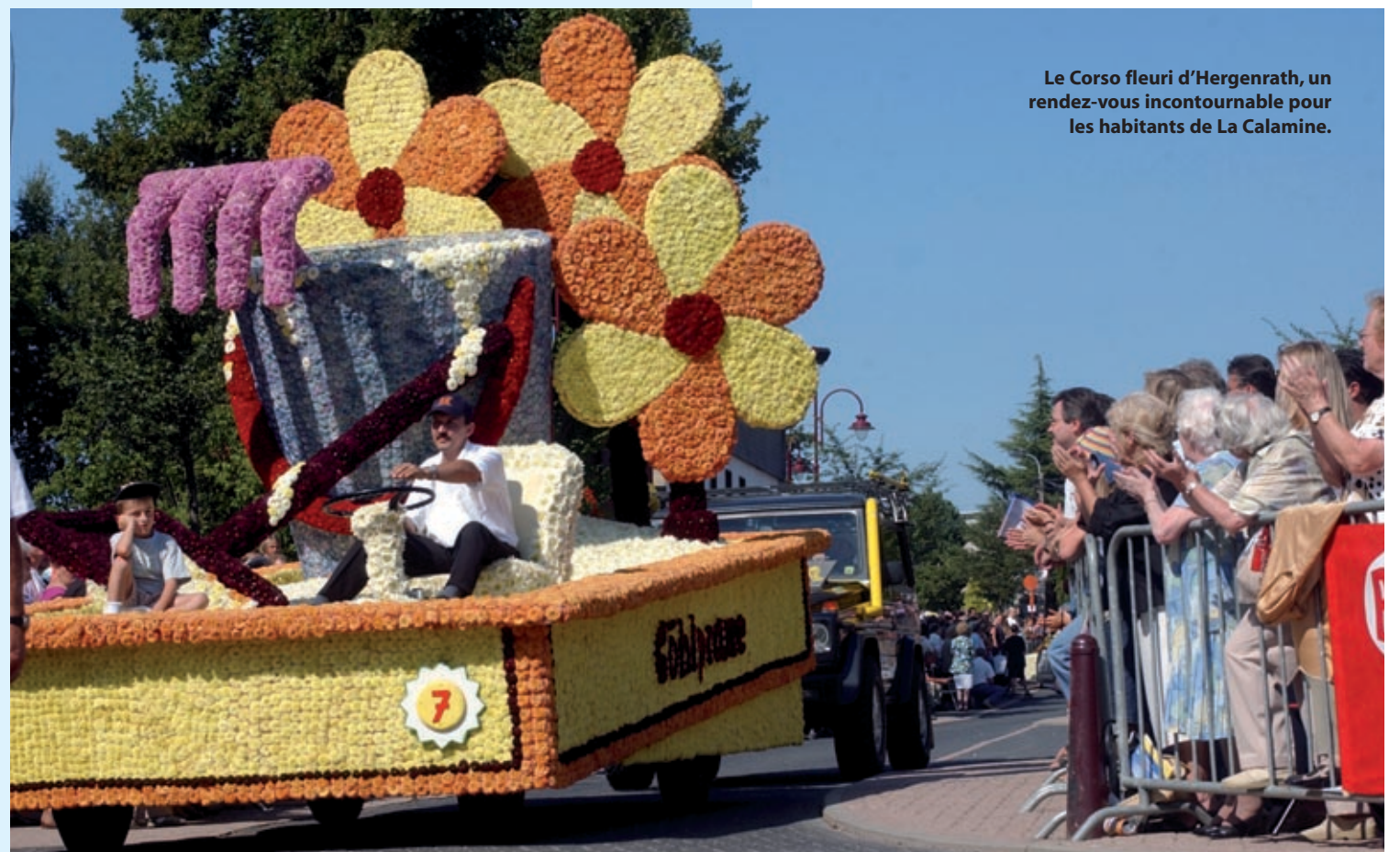
Le Corso fleuri d'Hergenrath, un rendez-vous incontournable pour les habitants de La Calamine.

EXPOSITION D'ANIMAUX STANDS DE PRODUITS DE BOUCHE STAND POLICE/SÉCURITÉ TOURNOI DE PÉTANQUE JEUX D'ÉCHECS ANIMATION POUR ENFANTS (Parc Koul - Sa 10-20h/Di 10-20h)