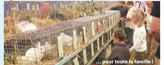
... pour toute la famille !

Votre journal et les organisateurs de la Foire Agricole de Battice-Herve vous proposent de gagner une entrée gratuite en vous rendant dans l'Antenne d'information de la Province de Liège la plus proche de chez vous, uniquement ce samedi 25 août entre 10 et 12h ! Il y en a quatre : à Huy (10, rue de l'Apleit), à Waremme (16, place du Roi Albert), à Verviers (1, rue des Martyrs) et à Eupen (16, Bergstrasse). 20 entrées gratuites vous attendent dans chacune d'elles. Les lauréats seront les 20 premières personnes à se présenter et à répondre correctement à la question suivante : quel est le nom du service de la Province de Liège qui assure une utilisation des sols respectueuse de l'environnement ? Réponse dans cet article !