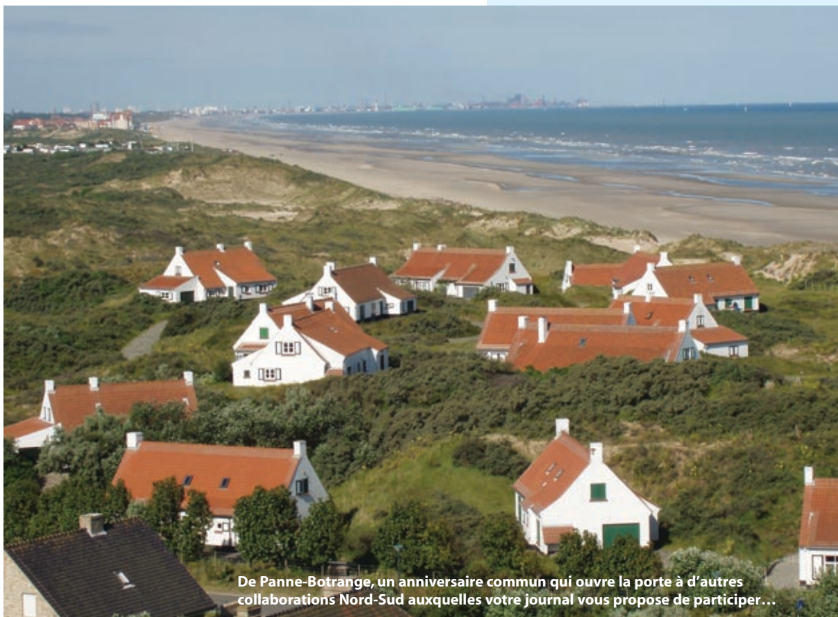
De Panne-Bostrange, un anniversaire commun qui ouvre la porte à d'autres collaborations Nord-Sud auxquelles votre journal vous propose de participer...

Infos : Centre Nature de Botrange au 080/ 44.03.00 ou www.centrenaturebotrange.be - Westhoek, Centre « De Nachtegaal » au 058/ 42.21.51 ou www.vbncdenachtegal.be - Office du Tourisme de La Panne au 058/42.97.22 ou www.depanne.be