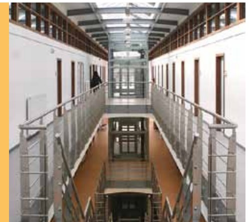
L'aménagement en atrium privilégie la communication des usagers.

rouges et une verrière attire l'attention sur l'entrée principale du bâtiment. L'intérieur est aménagé en atrium. La disposition des locaux (classes, auditoriums, bureaux), de part et d'autre de celui-ci, privilégie la communication entre les usagers et incite à un maximum de convivialité. Au rez : un hall d'accueil, un auditorium de 125 places, une cafétéria, 9 classes, vestiaires et sanitaires. Au 1 er étage : 10 classes, 6 bureaux, centre documentaire, ateliers informatiques. Le dernier niveau, abrité sous une impressionnante charpente métallique, accueille les fonctions administratives du Département Formation. ■