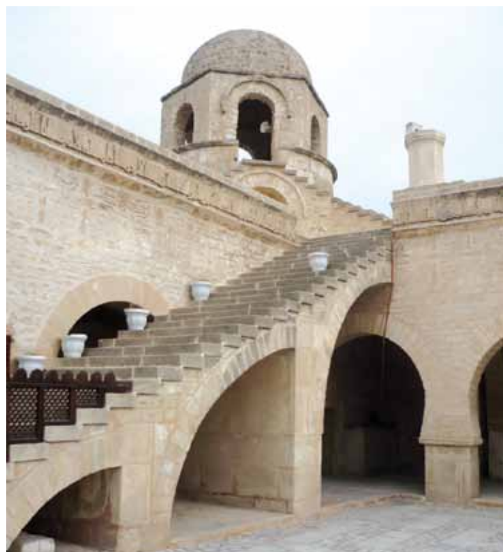
La grande mosquée de Sousse.

Pour profiter d'une vue en contreplongée sur la médina, il faut se rendre à la Kasbah toute proche. Une ancienne forteresse dont il ne reste que la Tour de Khalef. Elle permet aussi de contempler la grande mosquée. Près de la médina également, un musée propose des objets datant des origi-