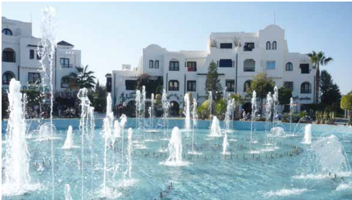
Port El Kantaoui, une station touristique paradisiaque à quelques kilomètres du centre de Sousse.

La signature de la charte d'amitié et de collaboration entre la Province de Liège et le Gouvernorat de Sousse remonte déjà au 23 mars 1992. En Tunisie, les gouvernorats sont un peu l'équivalent de nos provinces belges même si leurs territoires sont sou-