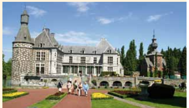
Les fêtes provinciales se dérouleront cette année le 23 mai au Château de Jehay.