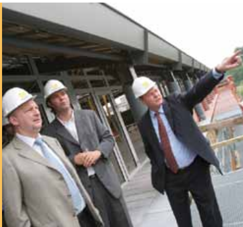
Visite de chantier par les autorités provinciales et communales en 2007.

Infos : 04/237.23.50 - maisondeslangues@provincedeliege.be - www.maisondeslangues.be (lire aussi notre article page 13)