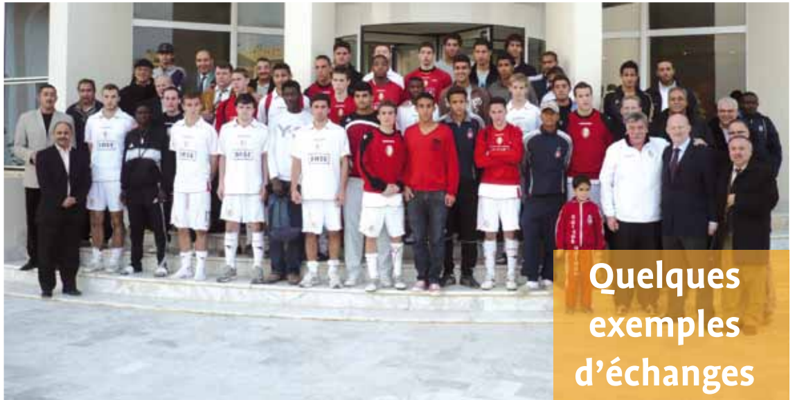
L'Étoile Sportive du Sahel a sollicité la Province de Liège afin qu'elle organise des échanges sportifs avec les Rouches. En décembre dernier, nos jeunes espoirs ont été hébergés au Star's Sport Résidence, le centre de formation de l'Étoile. Sur notre photo, la délégation provinciale emmenée par le Député provincial Georges Pire, et entourée par ses hôtes tunisiens.

Sa gestion est assurée par une société hôtelière et touristique. Il s'agit aujourd'hui d'un grand village traversé par des piétonniers. Ses murs d'une blancheur extrême renferment de somptueux jardins et une immense fontaine à jets d'eau. Un golf est également situé à proximité de la station qui propose de nombreux commerces, restaurants et cafés. Port El Kantaoui débouche aussi sur plusieurs kilomètres de plage. Quelques hôtels de luxe bordent le complexe. ■