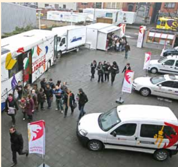
Les prochaines étapes du Village de la Province seront Waremme, Aywaille et Eupen.

Le Domaine touristique de Blegny-Mine accueille le Championnat de la Fédération Cycliste Wallonie-Bruxelles pour coureurs Espoirs et Elites sans contrat.