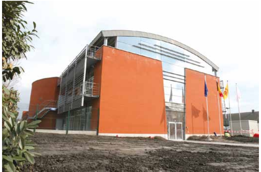
Installée à côté de l'Esplanade de l'Avenir à Seraing, la Maison de la Formation va accueillir chaque semaine des milliers de personnes en formation : membres des services de sécurité et fonctionnaires des pouvoirs publics.

La Maison de la Formation est installée à côté de l'Esplanade de l'Avenir sur des terres ayant appartenu à Cockerill. Elle va sans aucun doute contribuer à redynamiser Seraing. Ce nouveau site s'inscrit d'ailleurs dans le cadre de la rénovation urbaine entreprise depuis quelques années par les