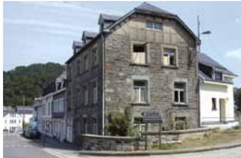
Ancienne poste, ancien presbytère, ancienne école... Les bâtiments réhabilités appartiennent à la mémoire collective des communes.

« Certaines communes s'investissent dans la construction de logements sociaux sur leur territoire, d'autres