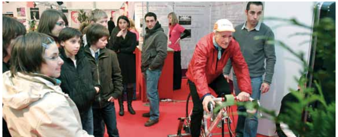
Un Village, entièrement gratuit et ouvert à tous, permet au public de découvrir les 22 compétences de la Province. Au programme : animations, démonstrations, jeux-concours...

Tout au long de la journée, un Village, entièrement gratuit et ouvert à tous, permet au public de découvrir les 22 compétences de la Province de Liège, ainsi que les initiatives et les actions qu'elle développe à destination des citoyens, des communes, des associations et des entreprises. Il donne donc l'opportunité aux différents services provinciaux de se faire connaître de façon ludique et attractive. C'est ainsi que lors de la rencontre à Spa, plusieurs d'entre eux avaient prévu des animations sur leur stand. Des vaches laitières pour l'Agriculture, des tests d'aptitude physique à l'effort cycliste