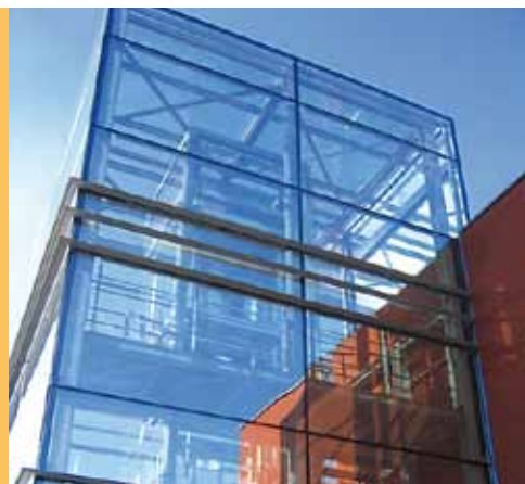
Le nouveau bâtiment se caractérise par ses briques rouges et ses verrières.

La Maison de la Formation illustre une nouvelle fois tout le savoir-faire des Services techniques de la Province, à la base de cette réalisation. Cinq ans de travaux auront été nécessaires pour ériger ce volume de 12 m de haut et d'une superficie de 5.000 m 2 dans le tissu urbain de la Cité du fer. Il se compose d'un rez-de-chaussée résolument tourné vers la fonction d'accueil et de deux niveaux consacrés à la formation et aux espaces administratifs. Il se situe sur un terrain de plus de 20.000 m 2 .